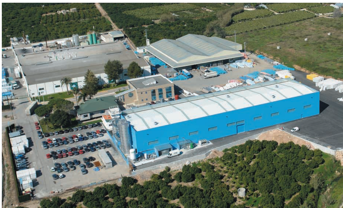
Vista aérea de la fábrica de Tavernes de Valldigna (Valencia).

Con un claro carácter internacional, Chova se ha planteado siempre su presencia en los mercados exteriores como estrategia, y ha fortalecido su marca en los mercados internacionales gracias a una importante presencia en estos ámbitos. Posicionada en la actualidad en el mercado nacional con una considerable cuota de mercado, la firma continúa con fuerza en los mercados exteriores. Su amplia red logística y de distribución le permite estar presente en países como Estados Unidos, Alemania, Turquía, Polonia, etc... hasta llegar a un total de 40.