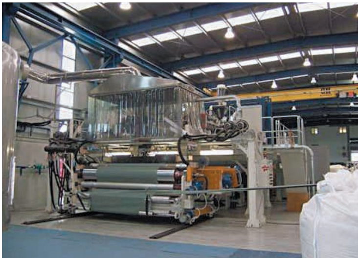
Planta de láminas drenantes en Vitoria.