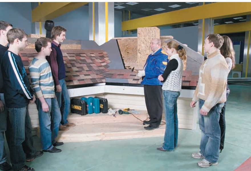
Centro de formación. Instalación Tégola Americana.

Además en ChovA, estiman necesario brindar un verdadero respaldo pre y post venta, que ayude a una correcta selección y utilización de los materiales que formarán parte del proyecto de edificación. Por eso, uno de los mayores activos de ChovA es su Departamento de Asistencia Técnica, formado por técnicos profesionales altamente cualificados. Un colectivo de vanguardia que les permite ofrecer un servicio de Asistencia Técnica para las distintas fases de la edificación. ■