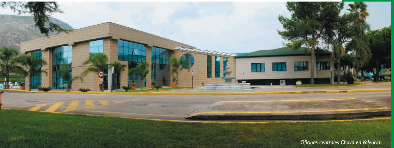
Oficinas centrales Chova en Valencia.

Todo esto ha permitido a la compañía ser pionera en muchos aspectos, destacando entre otros.