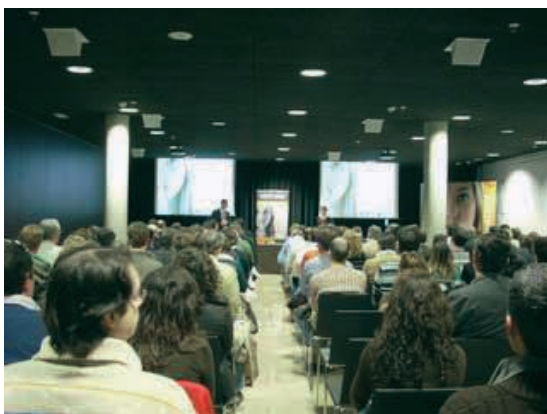
Centro de formación.