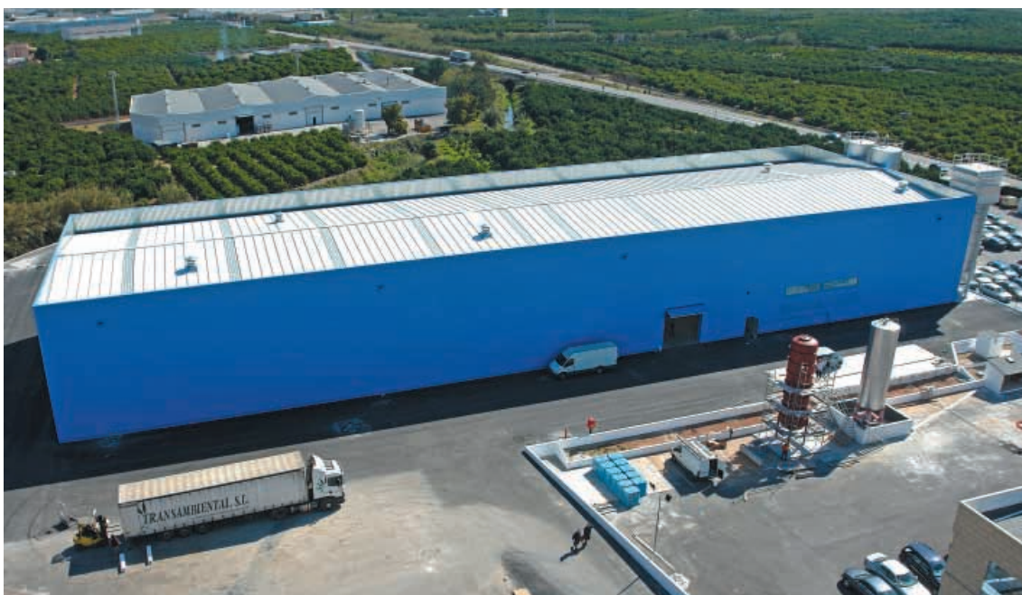
Planta productiva de ChovaFOAM XPS.

Los departamentos de I+D+i aprovechan las sinergias que se producen por la continua comunicación compartiendo las mejores prácticas.