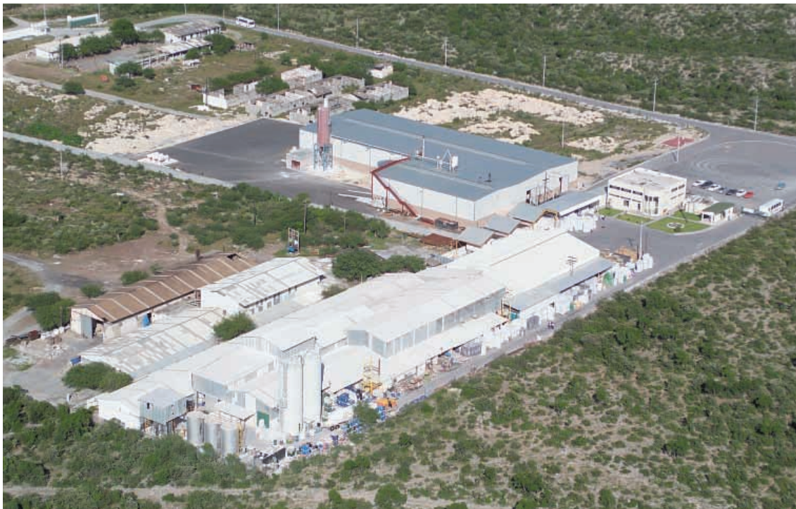
Planta de producción en Abasco (Mexico).