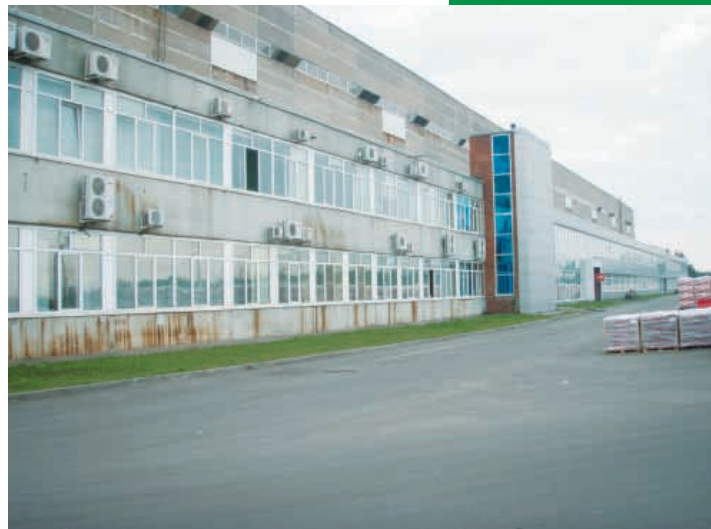
Planta de producción de Ryazan (Rusia).