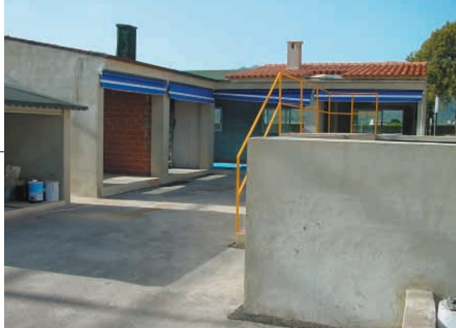
Zona de prácticas del centro de formación.

Chovastar es una marca que cuenta con la garantía de calidad Chova. En ella, se pueden encontrar productos para el sellado y pegado , adhesivos, reparadores